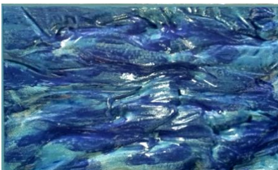
Kant en klaar ontwerp, 'De golven van de zee'

Naast de blanco gevelstenen, kun je bij de gemeente Harderwijk ook een aantal kant en klare gevelstenen kopen. Deze steen heet 'De golven van de zee' van kunstenaar Serge van Empelen en kost €400. De steen is te bestellen via waterfront@harderwijk.nl .